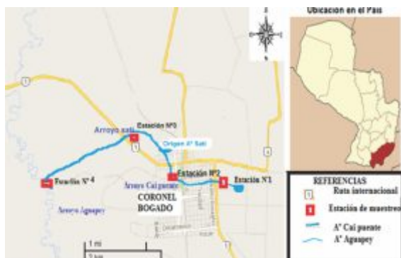
Figura N° 1. Mapa de los arroyos Ca'i Puente y Satí con las estaciones de muestreo.