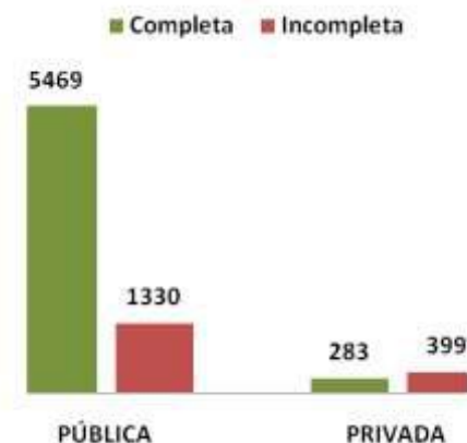
Gráfico 4: Descarga de Inmunizaciones

En cuanto a las inmunizaciones en el área pública de 6.799/24.920 expedientes el 80% presentaban registro de inmunización completa y el 20% incompleta. En el área privada sobre 682/712 expedientes el 41% presentaba registro de inmunización completa y el 59% inmunización incompleta.