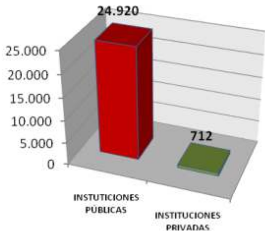
Gráfico 1: Total de Descargas

Se accedió al 100% de las Instituciones Públicas y al 29% de las Instituciones privadas. Se analizaron 25.632 expedientes clínicos, que representan el 25,76% del objetivo trazado. El 25% (24.920) corresponde a las Instituciones Públicas y el 0,76% (712) a las Instituciones Privadas.